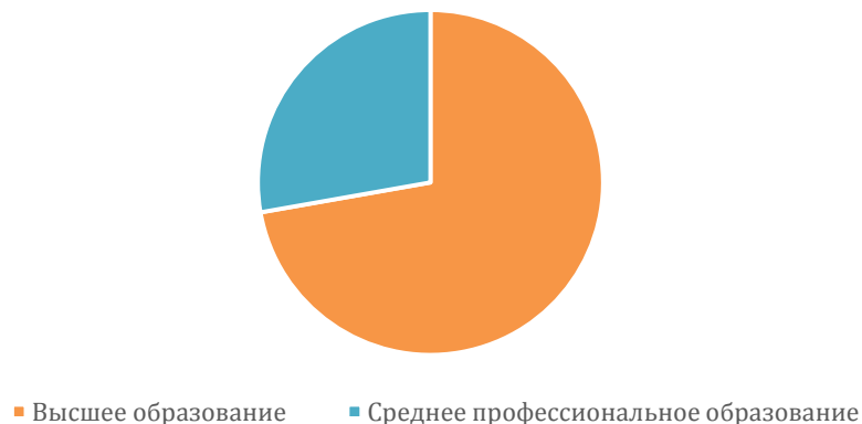
Образовательный ценз педагогического коллектива